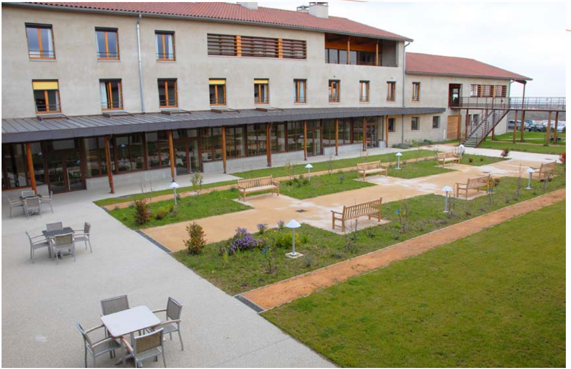
Etablissement d'Hébergement pour Personnes Âgées Dépendantes (EHPAD de 109 lits)

En plein coeur des Monts du Lyonnais, l'établissement « La Christinière » bénéficie d'une architecture moderne, dotée des dernières technologies, pour le confort et la sécurité des 109 résidents accueillis. Une équipe pluridisciplinaire y accueille en séjour temporaire ou définitif des personnes âgées d'au moins 60 ans. Les chambres, toutes individuelles, et disposant de salle de bains privatives, sont réparties en six unités de vie. Certaines chambres communicantes permettent également l'accueil des couples. Deux unités protégées sont réservées aux personnes atteintes de la maladie d'Alzheimer ou de maladie apparentée.